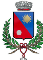
Comune di Solaro