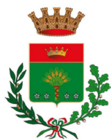
Città di Garbagnate Milanese