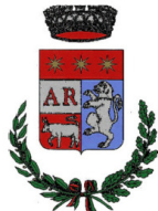
Comune di Barzio